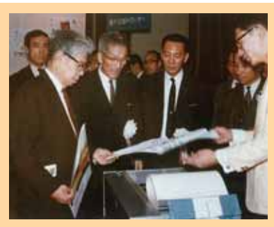
大阪にて電子リコピー BS-1 発表会 (1965.8)

故郷には苦難の思い出が満ちていた。人生の前半はそこから脱却するための戦いであった。しかし、老境に至って思い浮かぶのは懐かしい風景である。故郷のために何かしたいという感慨がわき上がってきた