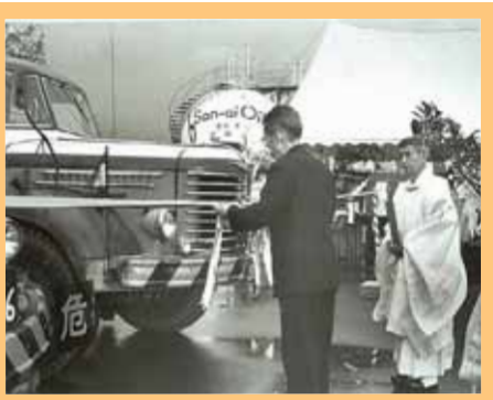
三愛石油羽田営業所開設 (1952.10.27) 燃料タンク車が飛行機のところまで行って給油している様子を眺めているとき、水道のようにホースを引っ張ってきて給油すれば効率が上がるとひらめいた。この着想がやがてハイドラントシステムによる給油となる