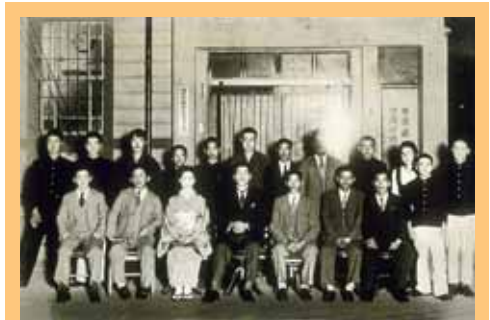
理研感光紙発足 (前列中央が市村) (1936.2.6) 1933年、理化学興業の感光紙部長となる。周囲の反発など紆余曲折を経て、36年、感光紙部を理研感光紙株式会社として創立、専務取締役に就任。吉村商会は解散し、理研感光紙福岡支店となる

52年、航空会社からの要請を受けて、航空燃料を供給する「三愛石油」を創立。航空機への給油にハイドラントシステムを考案し、出願するが、内外の石油資本の競願となる。市村は「日本の空の玄関は、日本人の手でやるべきであり、考えてプランを立てたのは自分である」とGHOに直訴、その