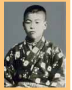
小学校4、5年生(1910) 貧しい生活だったが、成績 抜群、遊びやいたずらでも リーダー格だった

大学2年のとき、資本主義にある不合理から貧富の差が激しくなり、それを改革するために共産主義が起ったという講義を聴いて、衝撃を受け、共産主義に傾倒。一方で、故郷の父母のことを思い、考え悩む日が続いた。当時、共産主義の実践運動は当局の弾圧下にあったからだ。