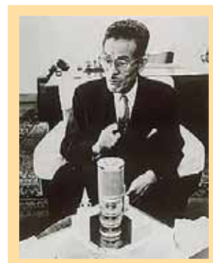
三愛ドリームセンターの模型を前に構想を練る (1960頃) 円筒形のビルの着想は、奈良法隆寺の五重塔から得た。建物そのものが斬新だったため、あらゆる設備が新たに考案された

アメリカではコーラやコーヒーみたいなの付いた飲み物が好まれているらしい。日本人はアメリカのまねが好きだから、きっとコーラも飲むようになる、と確信して事業を引き受けた