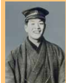
中央大学の学生時代 (1920) 貧しさのあまり、共産主義に傾倒したり、結核を患ったりしたが、翻意して肉体と精神の健康を取り戻す