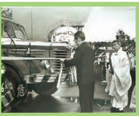
三愛石油羽田営業所開設 (1952.10.27) 燃料タンク車が飛行機のところまで行って給油している様子を眺めているとき、水道のようにホースを引っ張ってきて給油すれば効率が上がるとひらめいた。この着想がやがてハイドラントシステムによる給油となる