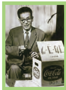
コカ・コーラ第1号が 空輸便で届く (1963.5.4)

リコー三愛グループの中核であるリコーを無配としたため、世間の非難を浴びた。再建のための諸施策がとられ、その原動力となったのが電子リコピーの完成であった。そして、わずか2年半で復配を実現する