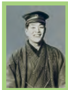
中央大学の学生時代(1920) 貧しさのあまり、共産主義に傾倒したり、結核を患ったりしたが、翻意して肉体と精神の健康を取り戻す