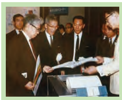
大阪にて電子リコピー BS-1 発表会 (1965.8)

故郷には苦難の思い出が満ちていた。人生の前半はそこから脱却するための戦いであった。しかし、老境に至って思い浮かぶのは懐かしい風景である。故郷のために何かしたいという感慨がわき上がってきた