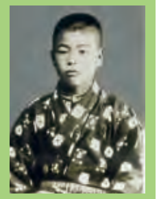
小学校4、5年生(1910) 貧しい生活だったが、成績抜群、遊びやいたずらでもリーダー格だった

大学2年のとき、資本主義にある不合理から貧富の差が激しくなり、それを改革するために共産主義が起ったという講義を聴いて、衝撃を受け、共産主義に傾倒。一方で、故郷の父母のことを思い、考え悩む日が続いた。当時、共産主義の実践運動は当局の弾圧下にあったからだ。