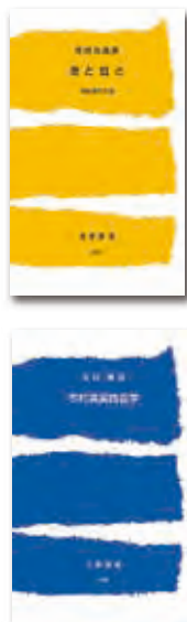
『茨と虹と市村清の生涯』(改訂版)