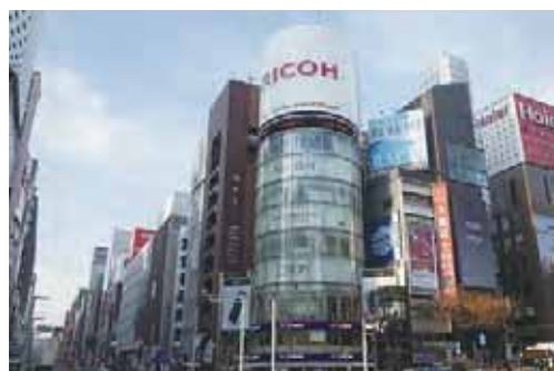
■所在地 東京都中央区銀座 5-7-2

佐賀県の貧農の家に生まれながら、数々の困難を乗り越えて、リコー三愛グループの礎を築いた創業者・市村清。その原動力となったのは卓抜たるアイデアとたゆまぬ実行力、そして故郷を愛する心でした。ゆかりの地を訪ね、その足跡に触れて、「人を愛し 国を愛し 勤めを愛す」の精神に徹して走り続けた市村の生きざまを感じてみてはいかがでしょうか。