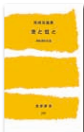
『茨と虹と市村清の生涯』 (改訂版)