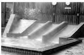
滑り台のある露天風呂