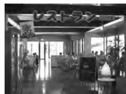
やすらぎ館内レストラン