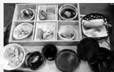
体に優しいメニュー