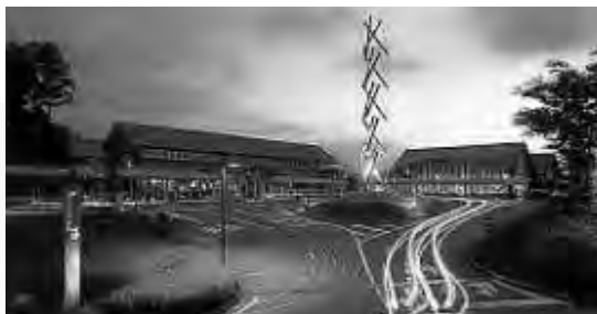
阿蘇白水温泉 瑠璃外観