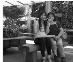
道の駅で鮎を堪能（お母様と）