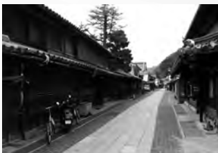
竹原の町並み保存地区