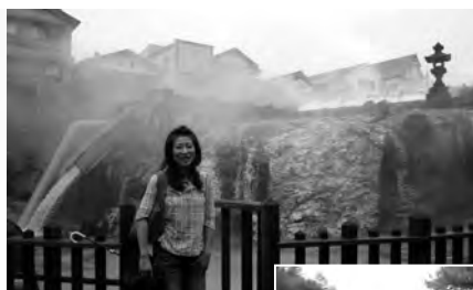
蒸気を噴出する“湯畑”