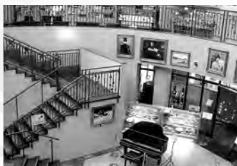
広い空間の中央吹き抜け