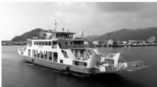
竹原港よりフェリーで