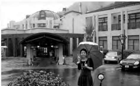
いよやかの郷の前で