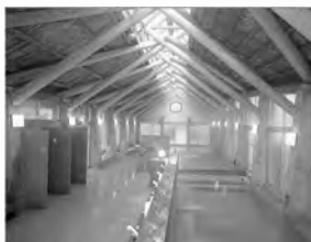
かけ干しに稲わらをイメージした 「かけ干しの湯」