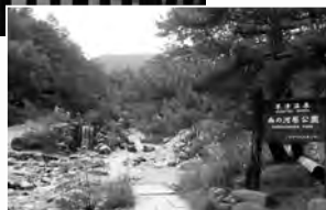
草津温泉 西の河原公園内