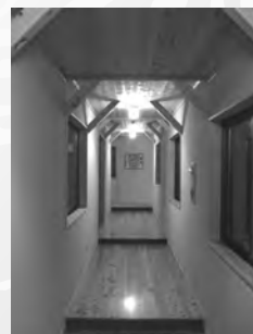
長い廊下を通過って浴場へ