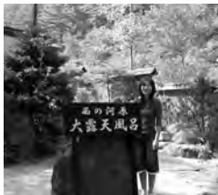
西の河原大露天風呂前にて