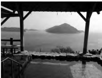
瀬戸内ひとり占め露天風呂