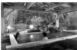
静かな露天風呂。 今時期は紅葉をめでながら…