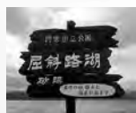
屈斜路湖畔の砂湯。砂を掘ると温泉が出ます