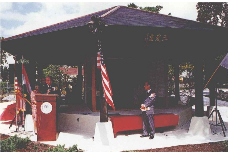
三愛堂。この写真のように、畳や障子を入れて、茶室としても使用できる