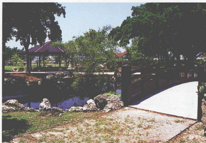
太鼓橋から三愛堂をのぞむ