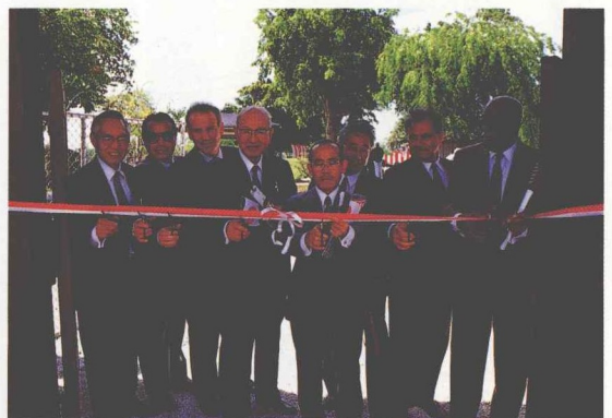
正門前でテープカット。中央手前は、 新田マイアミ総領事