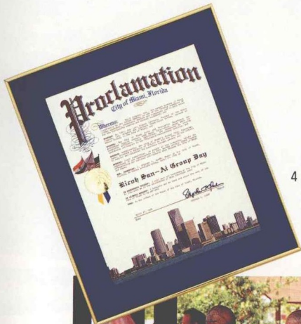
4月21日を“リコー三愛 グループの日”と定める 宣言書（左）が手渡された