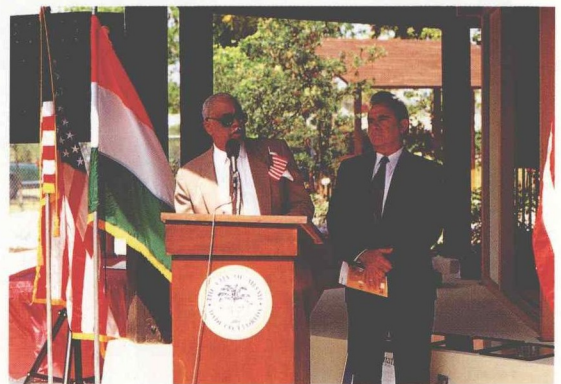
お祝いの言葉を述べるドーキンス氏